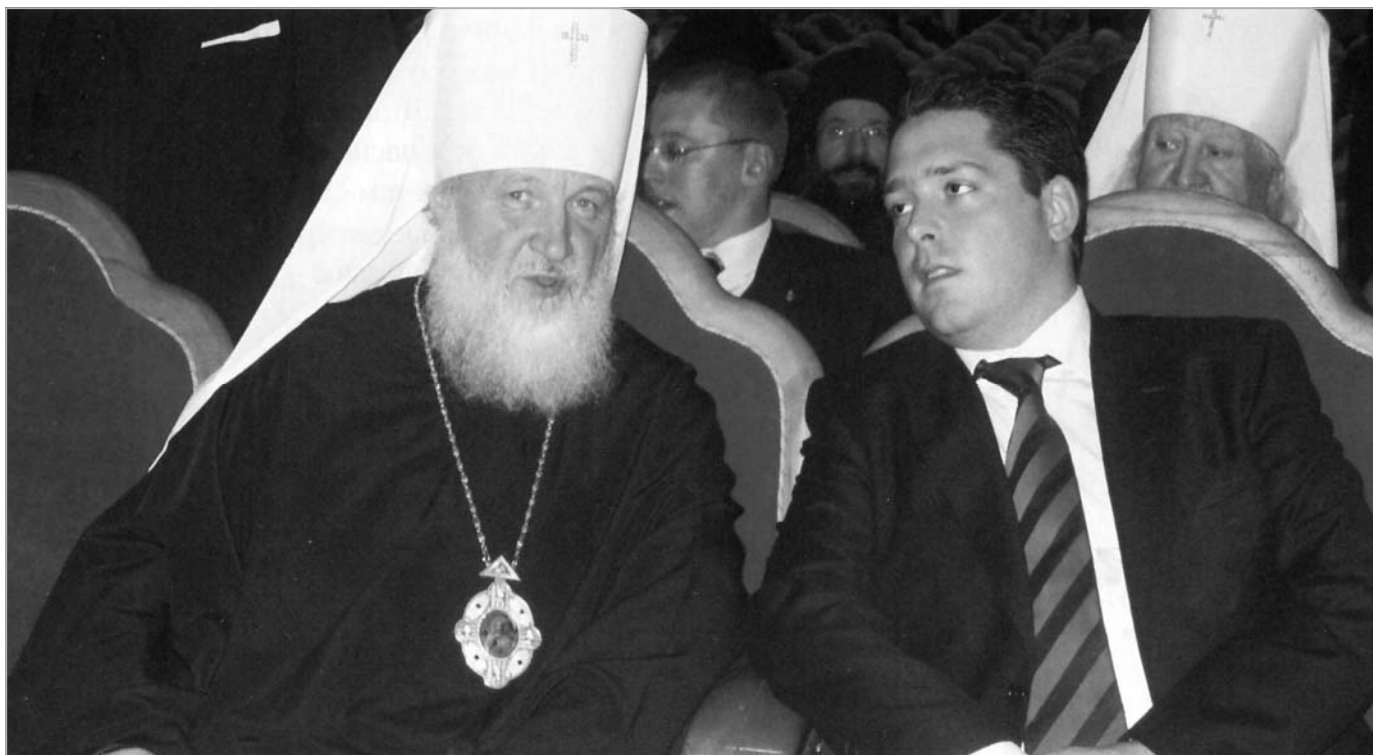
Государь Великий Князь Георгий Михайлович и митрополит Смоленский и Калининградский Кирилл (2008 г.)

стинской капеллы. Среди автомобилей нравится “Мустанг”. Что касается стран, то, конечно, – Россия. Это моя Родина и самая любимая страна. В Европе люблю также Испанию и Францию.