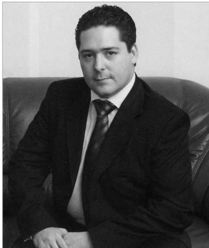
Е.И.В. Наследник Цесаревич Государь Великий Князь Георгий Михайлович

В духовном смысле канонизация, безусловно, несравненно выше юридической реабилитации. Но, в принципе, это совершенно различные вещи, не противоречащие одно другому, а дополняющие друг друга. Канонизация – это прославление в лике святых, признание религиозных добродетелей и подвигов, а реабилитация – это признание факта, что в отношении граждан тоталитарным государством допущены беззаконие и произвол по религиозным, социальным и классовым признакам. Нам не могло быть безразлично, что наши святые юридически продолжают считаться врагами народа, которых лишили свободы и казнили правильно. Кроме того, до тех пор, пока решение Уралоблсовета о расстреле Царской Семьи, утвержденное высшим органом государственной власти РСФСР – Всероссийским Цен-