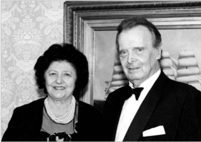
Императорская Чета. (Конец 1980-х гг.)

кий Князь Андрей Владимирович приехал познакомиться с женой своего царственного племянника, он сказал Ей: “Больше гадостей, чем говорили про Императрицу Александру Феодоровну, никто, никогда и ни о ком не говорил. Поэтому, что бы тебе ни делали, что бы о тебе ни говорили, не обращай внимания. Исполняй свой долг, помогай Владимиру” . Этому завету Государыня следует всю Свою жизнь. Ей, как и Св. Царице-Мученице Александре, довелось сполна испить чашу клеветы и злобы ненавистников исторической России, но Она никогда не падала духом и не сдавалась. 44 года Великая Княгиня разделяла труды мужа. И поныне, несмотря на Свои 94 года, Она всеми силами старается помогать Своей Августейшей Дочери – Главе Российского Императорского Дома Государыне Великой Княгине Марии Владимировне.