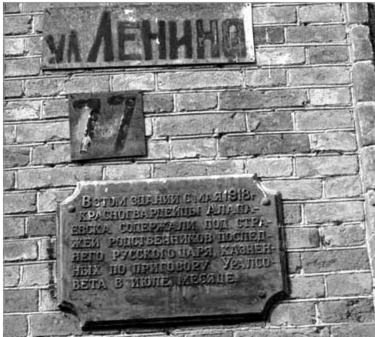
Место двухмесячного заточения Членов Императорского Дома в Алапаевске до сих пор находится на улице имени их главного палача.

На табличке, установленной на стене здания бывшей Напольной школы вылита саморазоблачительная надпись: "В этом здании с мая 1918 г. красногвардейцы Алапаевска содержали под стражей родственников последнего русского царя, казненных по приговору Уралсовета в июле месяце."