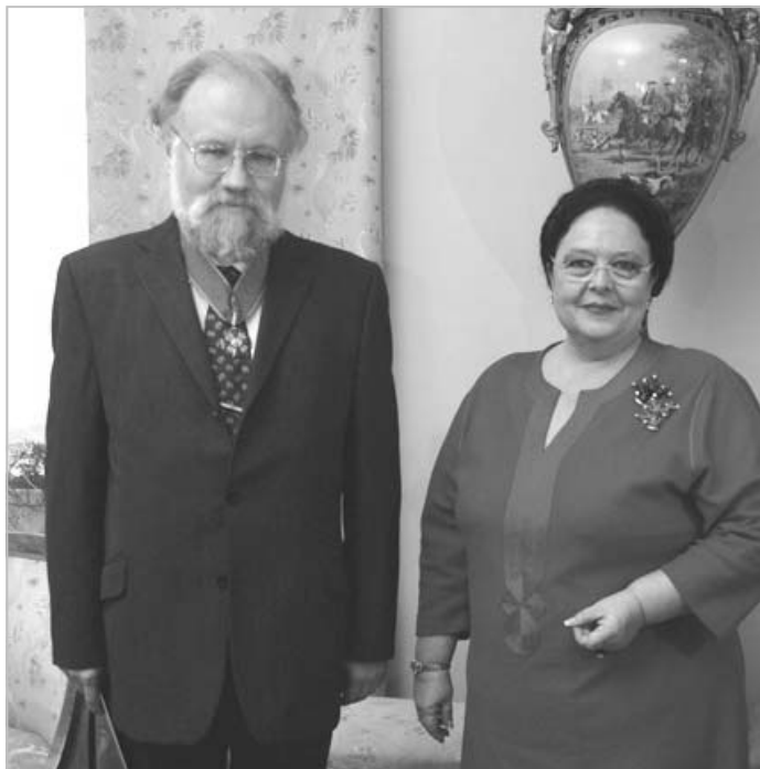
Государыня и Председатель Центральной Избирательной Комиссии РФ В.Е.Чуров после церемонии награждения его знаками Ордена Св. Анны II степени.

Также в ходе приема Великая Княгиня Мария Владимировна обменялась приветствиями с Председателем Правительства РФ В.В. Путиным и Руководителем Администрации Президента РФ С.Е.Нарышкиным, беседовала с Иерархами Русской Православной Церкви, председателем Центрального духовного управления мусульман России Верховным Муфтием Шейх-уль-исламом Талгатом Таджуддином и Председателем Совета муфтиев России Шейхом Равилем Гайнутдином, представителями других традиционных религий России, заместителем Председателя Государственной Думы Федерального