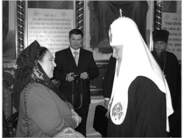
Государыня поздравляет Святейшего Патриарха Московского и всея Руси Кирилла с интронизацией