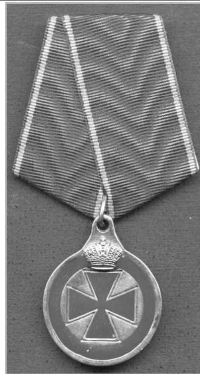
Анненская медаль образца 2009 г.

бивался порядковый номер, а в углубления креста и круга на обеих сторонах знака заливалась красная мастика. Получившие знак одновременно получали из пенсионных фондов Ордена Святой Анны жалование, равное тому, которое производилось им по службе, а по выслуге указанных лет жалование сохранялось до самой смерти, где бы ни находились награжденные. Согласно указу Военной коллегии, изданного в апреле 1800 года, было установлено, что при производстве в офицерские чины знак отличия Святой Анны, полученный в унтер-офицерских чинах, носить не снимая.