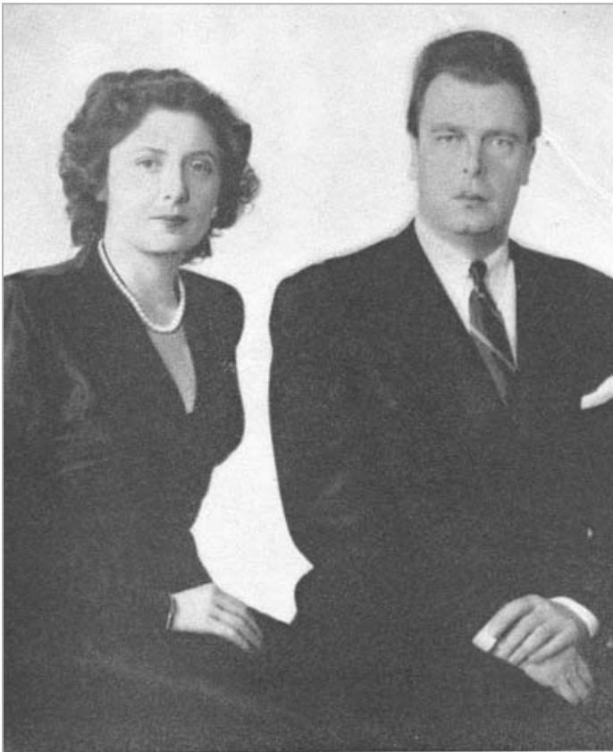
ГЛАВА РОССИЙСКОГО ИМПЕРАТОРСКОГО ДОМА Его Императорское Высочество, Великий Князь ВЛАДИМИР КИРИЛЛОВИЧ с Августейшей Супругой, Великой Княгиней ЛЕОНИДОЙ ГЕОРГИЕВНОЙ

Императорская Семья вскоре после бракосочетания. Эмигрантская открытка