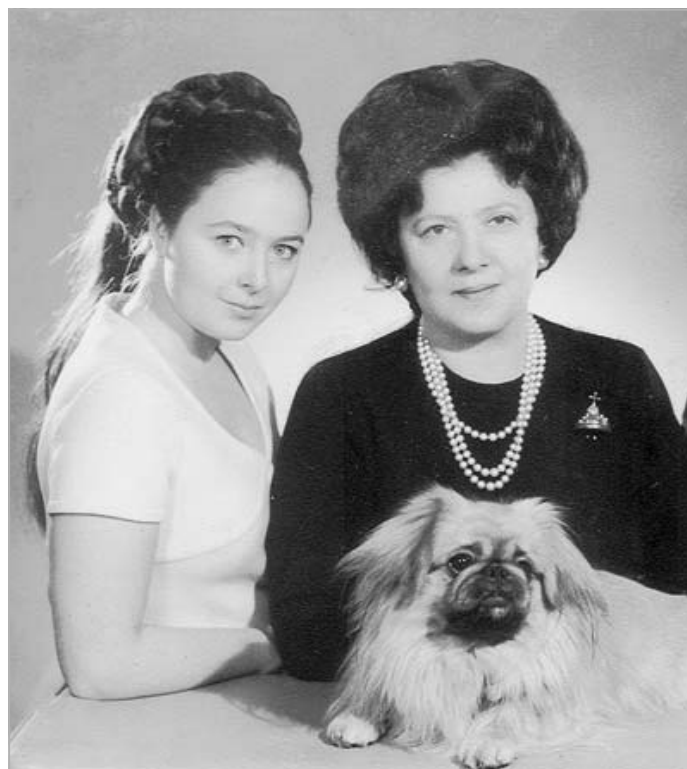
Е.И.В. Государыня Великая Княгиня Леонида Георгиевна с дочерью Е.И.В. Государыней Великой Княжной Марией Владимировной

В течении нескольких лет после заключения брака у Государя и Государыни не было детей. Это огорчало и беспокоило Их как чисто по человечески, так и в