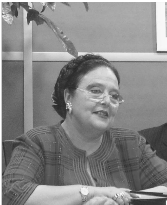
Е.И.В. Государыня Великая Княгиня Мария Владимировна

Ответы Главы Российского Императорского Дома Е.И.В. Государыни Великой Княгини Марии Владимировны на вопросы журнала “Рандеву” (Казахстан)