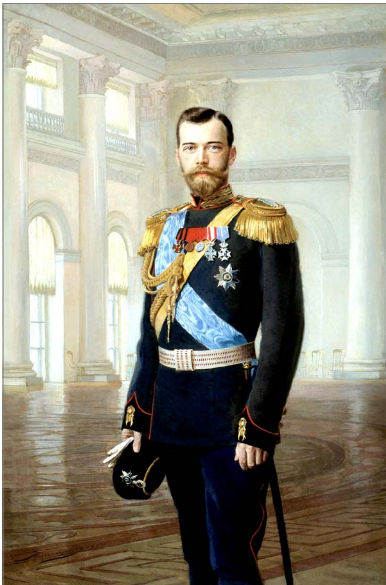
Его Величество Государь Император Николай II Александрович

17 июля Россия отметила трагическую дату истории нашего государства — 90 лет со дня расстрела Императора Николая II и Его Семьи. По этому случаю в Екатеринбурге прошли ставшие уже традицией Дни памяти Царственных Страстотерпцев. На "Царские Дни" в Екатеринбург, на место Русской Голгофы, съехались десятки тысяч человек со всей России и других государств мира, дабы почтить память Святого Императора Николая Александровича и Его Семьи. Как говорится в послании Святейшего Патриарха, "Десятилетия, запечатленные в истории нашей страны страданиями войны, братоубийственными распрями, голодом, и, небывалыми по масштабам репрессиями, во многом были обусловлены нравственными ошибками, коренящимися в отступлении людей от вечных истин, данных Богом. Хотелось бы надеяться, что период богоборчества и связанных с ним испытаний безвозвратно ушел в прошлое. Добрые приметы этого можно видеть в духовном облике нашего времени: происходит возвращение общества к непреходящим ценностям веры, повсеместно возрождаются из небытия православные святыни, уральская земля, политая кровью невинных страдальцев, принимает сегодня десятки тысяч паломников, со всех концов России и из-за рубежа стекающихся, дабы поклониться подвигу Святых Царственных Страстотерпцев". Юбилейные "Царские Дни", посвященные 90-летию расстрела Царской Семьи, ознаменовались тем, что в