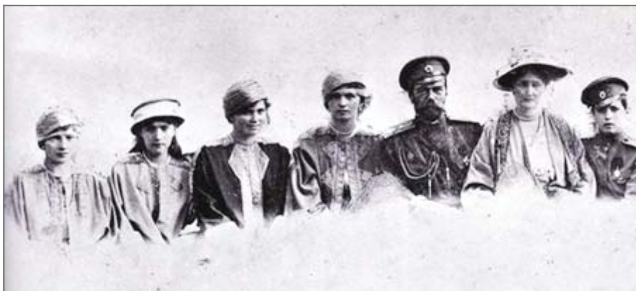
Царская Семья в 1917 г.