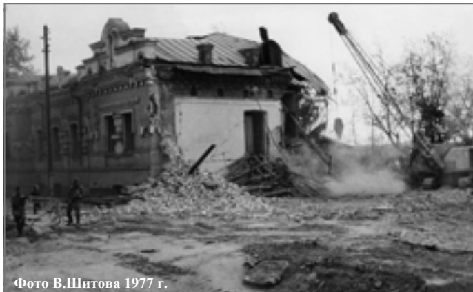
1977 г.

дом, памятником человеческому варварству. К тому же за границей якобы объявились наследники Ипатьева, которые намерены вытребовать свою собственность. О том, каким образом наследникам удастся что-либо отобрать у советской власти, переносчики слухов не задумывались. Внимание иностранцев к достопримечательности также представляется преувеличенным: их в Свердловск не пускали, город в то время был "закрытым".