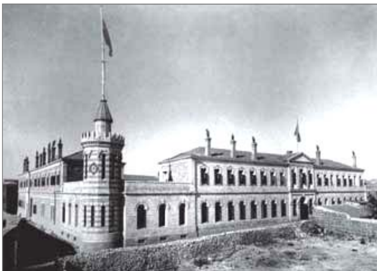
Сергиевское подворье в конце XIX века