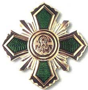
Знак ордена Св. Сергия Радонежского

21 июля 2008 г., в день Казанской иконы Пресвятой Богородицы, исполнилось 15 лет со дня архиерейской хиротонии Епископа Никона (Миронова), управлявшего Екатеринбургской епархией в 1994-1999 году. В настоящее время Владыка служит настоятелем московского храма Успения Пресвятой Богородицы в Вешняках, в Москве.