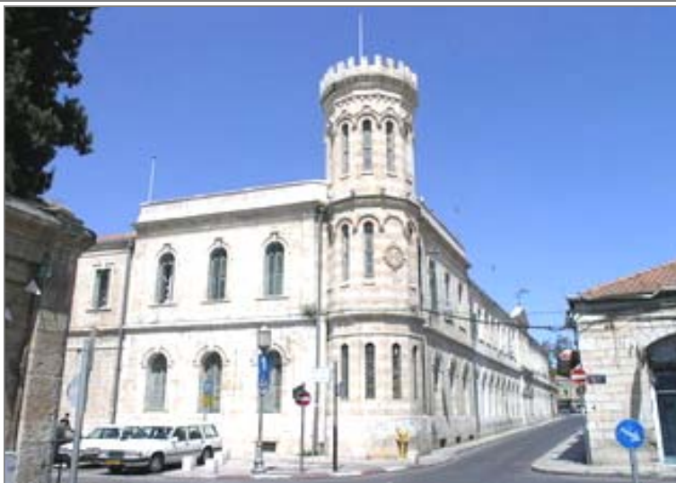
Сергиевское подворье в Иерусалиме сегодня