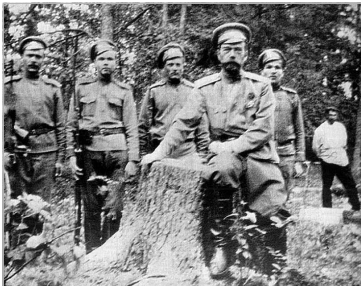
Государь в дни ареста в Царском Селе 1917 г.

Все эти экспонаты убеждают — была большая дружная семья, были искренние отношения... Но были и многочисленные проблемы и трудности государственного нестроения, военного и революционного лихолетья, которые превратили в конце концов для Романовых Царский Венец в Царский Крест.