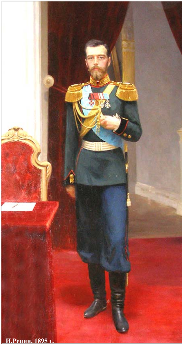
И.Репин. 1895 г.

Принципиальные, существенные изменения в устройстве русского государства после реформ 1905-07 гг. также не были лишь следствием революционных потрясений, а явились сознательным выражением воли Государя к участию общества в управлении страной. Император Николай Александрович ясно понимал недостаточность представительного образа правления и одновременно не питал иллюзий относительно настроений общества. В разговоре с Витте (1905 г.) он сказал: "Я отлично понимаю, что создаю себе не помощника, а врага,