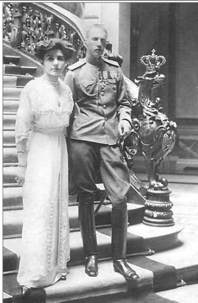
Августейшие родители Княжны Екатерины Иоанновны