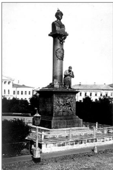
«Ивану Сусанину - за Царя, спасителя веры и Царства, живот свой положившему»

В апреле с.г. в стенах костромского Свято-Троицкого Ипатьевского монастыря в конце марта с.г. был выставлен макет памятника Ивану Сусанину и Царю Михаилу Феодоровичу Романову. Поводом для открытия экспозиции стало постановление главы города Ирины Переверзевой «О проведении комплексной реконструкции на территории Сусанинской площади».