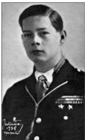
Король Михай I в 17 лет

нистам. Мы апеллировали к западным союзникам, но безуспешно. Запад просто отдал Румынию Сталину» – говорит Король Михай.