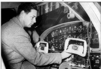
Король Михай в эмиграции

«Я вышел в другую комнату, – вспоминает Михай. – Вскоре заходят министр двора и мой секретарь и говорят: «Телефонная связь дворца отключена, охрана заменена». Я выглянул в окно и увидел, что дворец окружен военными одной из румынских дивизий, включенных в состав советского контингента. Они были в советской форме. Вокруг виллы – артиллерийские орудия, стволы направлены на нас. Я вернулся к Грозе, Георгиу-Дежу и говорю: «Это так не решается. Свою волю должен выразить народ». Они мне отвечают: «У нас нет на это времени! Если Вы не отречетесь в течение получаса, мы расстреляем тысячу студентов-сторонников монархии, которые посажены в бухарестскую тюрьму», – рассказывает Монарх. – Я не считал себя вправе бороться за власть ценой людских жизней. И подписал манифест». «Тут Гроза заулыбался и говорит: «Пощупайте мой карман». В кармане оказался пистолет. Тогда Гроза повернул-