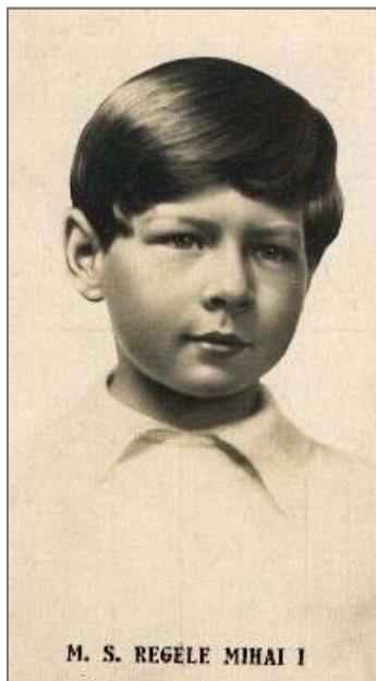
M. S. REGELE MIHAI I

Правление маленького Михая I продлилось всего три года, после чего Его отец вернул себе трон в 1930 году на 10 лет, снова сделав сына Наследным Принцем, предоставив сыну титул Великого Воеводы Алба-Юлии (город на западе Румынии), а бывшую жену Королеву Елену выслал за границу. В 1940 году при активном вмешательстве гитлеровских эмиссаров Король Кароль II был вынужден отречься от престола в пользу 19-летнего Михая и назначить на должность премьер-