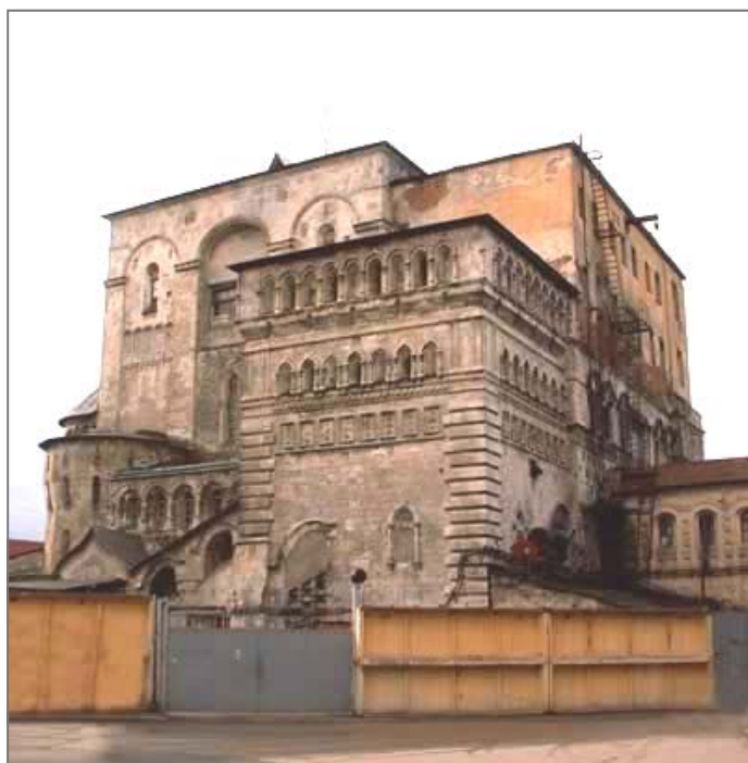
Храм в наши дни

Полностью храмовый комплекс обещают восстановить к 2013 году – столетнему юбилею храма и четырехсотлетию юбилею Дома Романовых.