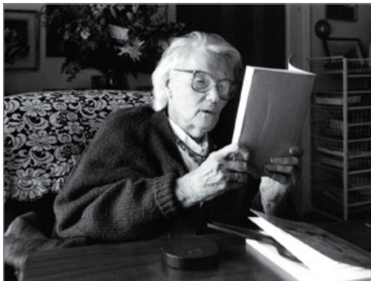
Е.С. Княжна Крови Императорской Вера Константиновна. 1998 г.

В ноябре 1952 Вера Константиновна стала участвовать