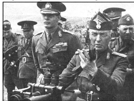
Король Михай I и маршал И.Антонеску

«В 1940 году две провинции, Бессарабия и Буковина, которые мы до сих пор считаем своей землей, были аннексированы СССР в результате пакта Молотова-Риббентропа, – рассказывает Михай I – Вернуть эти территории – это было для нас в порядке вещей. Но продолжение войны на стороне Германии за их пределами – это для нас было неприемлемо. Насколько я знаю, Антонеску так и не заключил с немцами никакого формального соглашения о союзе. Все делалось на основе устных договоренностей».