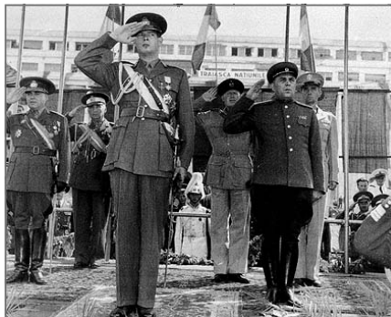
Король Михай I и маршал Ф.И.Толбухин