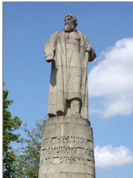
«Ивану Сусанину - патриоту земли русской»

Пресс-служба РМД по материалам сайта администрации г. Костромы и ТВ-Центр.