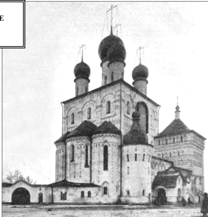
Храм в 1913 году

Двухэтажный храм был торжественно заложен 5 августа 1911 г. в присутствии Великого Князя Михаила Александровича, покровителя строительного комитета. Храм представлял собой синтез «цитат» из различных школ русского зодчества. Воротная башня монастыря из Суздаля, церковь с башней из Ростова, ворота из Пскова. Стены самого храма, напоминающие стены московского Кремля совместили закладные кресты Новгорода и владимиросуздалскую резьбу. Фасад храма, облицованный белым