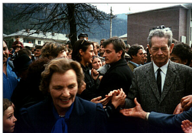
Встреча Короля Михая на Родине

Подготовлено на основе материала BBCMMVII. Интервью Константина Эггерта. «Последний монарх Европы эпохи Второй мировой» 24.05.2007. http://news.bbc.co.uk