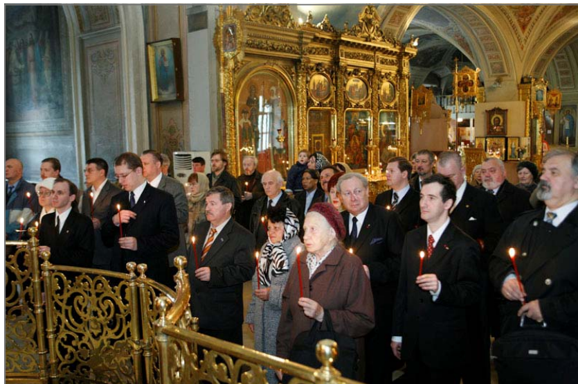
Во время панихиды в Богоявленском кафедральном соборе