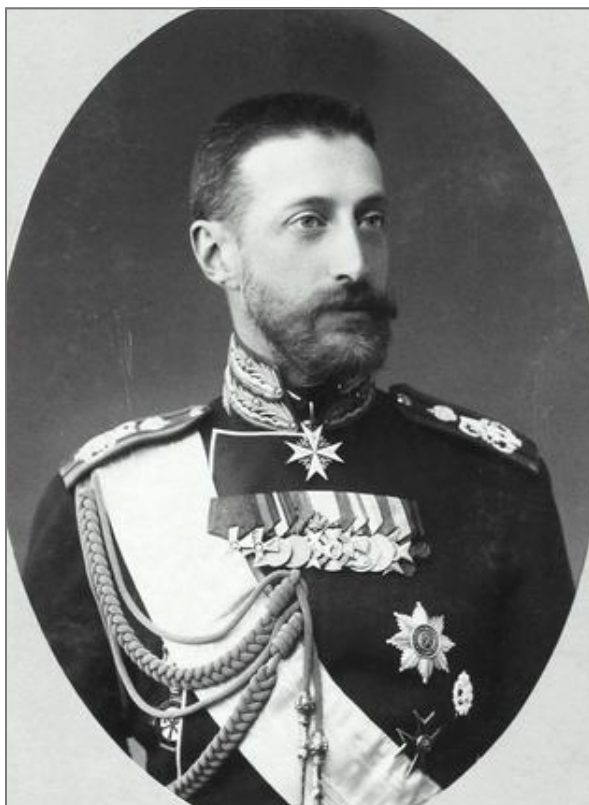
Великий Князь Константин Константинович

в работе "Общества помощи русским детям за рубежом", также сотрудничала с Толстовским Фондом, в котором работала затем до 1969 г. Одновременно она участвовала в работе Попечительского совета о нуждах Русской православной Церкви за рубежом.