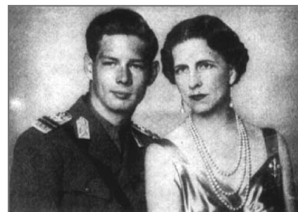
Король Михай I с матерью – Королевой Еленой

Далее последовали почти полвека изгнания, работа птицеводом, летчиком-испытателем и биржевым маклером; счастливая женитьба на Принцессе Анне Бурбон-Пармской, рождение четырех дочерей и, наконец, небеспроблемное возвращение в Румынию через несколько лет после падения диктатуры Николае Чаушеску. В 1997 году Румыния вернула Королю гражданство, а позже предоставила и официальный статус. Кроме этого государство вернуло Его Величеству часть собственности и выплатило компенсацию.