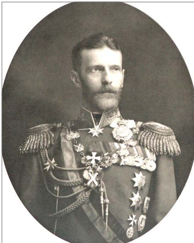
Великий Князь Сергей Александрович

Патриарх Московский и Всея Руси Алексей II направил приветствие в адрес организаторов и участников выставки, организованной к 150-летию со дня рождения Великого Князя Сергея Александровича. В нем Предстоятель Русской Православной Церкви, в частности, отметил, что «празднуя эту годовщину, мы вспоминаем Великого Князя как выдающегося государственного деятеля, человека глубокой веры, твердого духа и праведной жизни, которую он всецело посвятил служению на благо Отечества.