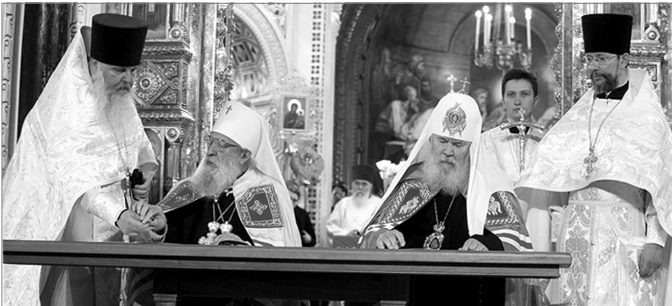
Святейший Патриарх Московский и всея Руси Алексий II и митрополит Восточно-Американский и Нью-Йоркский Лавр подписывают Акт воссоединения

Напомнив, что первыми словами, которые Христос сказал Своим ученикам по Воскресении, были слова: «Радуйтесь!» и «Мир вам!», митрополит Восточно-Американский и Нью-Йоркский Лавр сказал: «В нынешний праздничный день мы слышим эти приветствия от Вознесшегося Господа, подающего нам радость единства, прославляющего нас Своим миром. Поздравляю всех с этой великой радостью! Прежде всего возношу благодарение Великому Пастыреначальнику Господу нашему Иисусу Христу, подавшему нам силу совершить это великое дело».