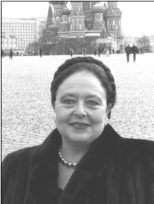
Глава Российского Императорского Дома Е.И.В. Государыня Великая Княгиня Мария Владимировна

Затем Глава Российского Императорского Дома отбыла в Академию Генерального Штаба Вооруженных